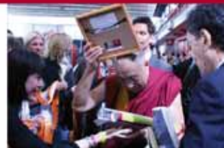
• 取于“奥秘的西藏艺术”的序言 - Longstreet Press