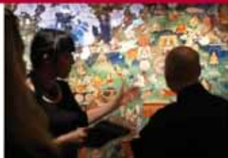
• 鲁宾艺术博物馆, 纽约