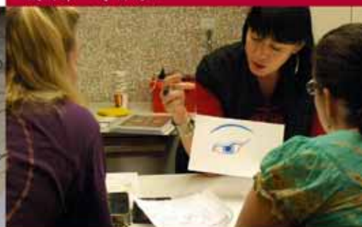
• 传统绘画技术的说明