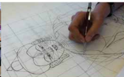
• 构图格框是个必不可少的传统绘画工具