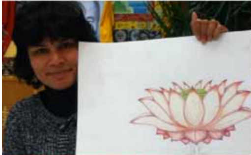
• 学习如何应用传统素描技巧