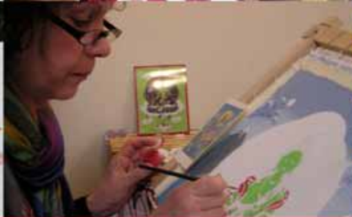
• 如何预备传统的唐卡画布